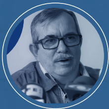
RODRIGO LONDOÑO ECHEVERRY