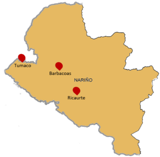
Informes presentados e incorporados al macrocaso 002

Auto de apertura: Auto SRVR 002 del 04 de julio de 2018