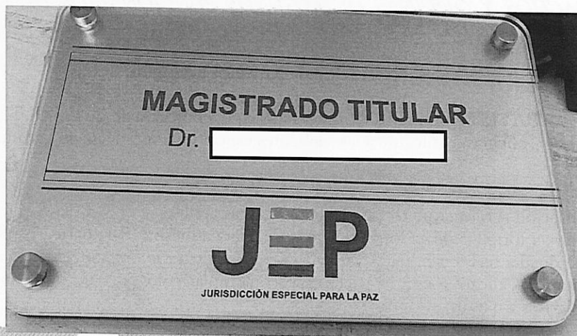
Foto No. 3 - Vista lateral